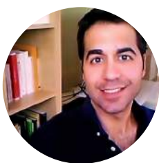
Por Álvaro Perea González Letrado de la Administración de Justicia

La Ley 42/2015, de 5 de octubre, ha significado un auténtico cambio de paradigma en el modelo relacional de las personas jurídicas y otros actores con la Administración de Justicia. Desde esta nueva realidad se torna ahora indispensable reinterpretar algunas normas procesales y, de forma ineludible, un artículo de aplicación tan habitual en la práctica como el vigente 32.5 de la Ley de Enjuiciamiento Civil.