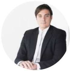
Por José Lasa Laffer Abogados

E n los últimos años hemos visto emerger la creciente actividad de una práctica como los e-sports, anteriormente delimitada en un ámbito mayormente cerrado y con poca capacidad de contacto con un tercer usuario, hacia un escenario global donde el espectador es parte principal de esta nueva y reciente industria.