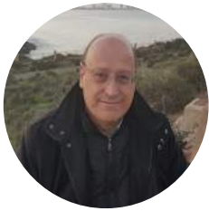
Por Ángel Berrocal Jaime Abogado Redactor del Área Social de Lefebvre

A la espera de alcanzar un acuerdo durante el primer semestre de 2019 entre las asociaciones de trabajadores autónomos más representativas y el Gobierno por el que se logre instaurar en el Régimen Especial de Seguridad Social de los Trabajadores por Cuenta Propia o Autónomos (en adelante, RETA) un sistema basado en la cotización por ingresos reales o tramos de cotización según ingresos (similar al establecido en el Régimen General de la Seguridad Social), cuya negociación no llegó a fraguar en el último año, la anhelada e histórica reivindicación para la total equiparación de este colectivo con el de los asalariados ha de conformarse, de momento, con las, no menos importantes, medidas incorporadas en el Real Decreto Ley 28/2018, de 28 de diciembre, para la revalorización de las pensiones públicas y otras medidas urgentes en materia social, laboral y de empleo, que fue publicado en el BOE el pasado día 29 de diciembre (convalidado por Resolución de 22 de enero de 2019, del Congreso de los Diputados -BOE de 29 de enero-).