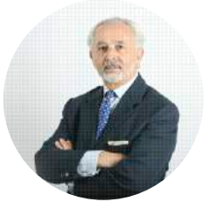
Por Juan Ramón Montero Estévez Presidente de la Sección de Derecho Deportivo

S e exhiben en la pasarela mediática, deportistas de élite —figuras públicas de prestigio e imagen de aficionados y jóvenes deportistas— sometidos a procedimientos penales.