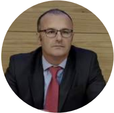
Por J. Salvador Esteban Rivero Abogado, Consultor Auditor jefe certificado IRCA

El pasado 21 de febrero de 2019 se publicó en el Boletín Oficial del Estado la Ley 1/2019, de 20 de febrero de 2019, de Secretos Empresariales con entrada en vigor, en virtud de su Disposición final sexta, el 13 de marzo de 2019. Con esta norma se incorpora al derecho español la Directiva (UE) 2016/943, de 8 de junio de 2016, relativa a la protección de los conocimientos técnicos y la información empresarial no divulgados (secretos comerciales) contra su obtención, utilización y revelación ilícitas.