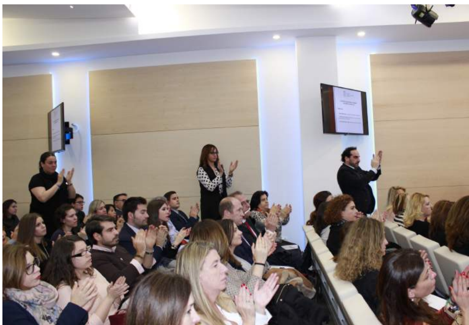
Colegiados y colegiadas del ICAM aplauden una de las intervenciones en la jornada de Aula de Debate dedicada a la prisión permanente revisable