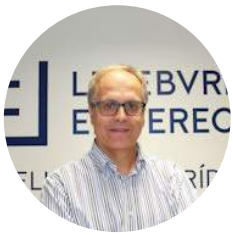
Por Francisco Martín-Caro García Abogado Redactor del Área Mercantil de Lefebvre